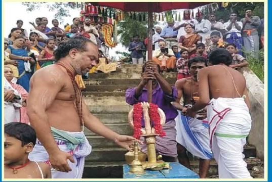
திருக்கோடிகாவல் ஸ்ரீ திருக்கோடீஸ்வரர் ஆலயத்தில் கார்த்திகை ஞாயிறு தீர்த்தவாரி