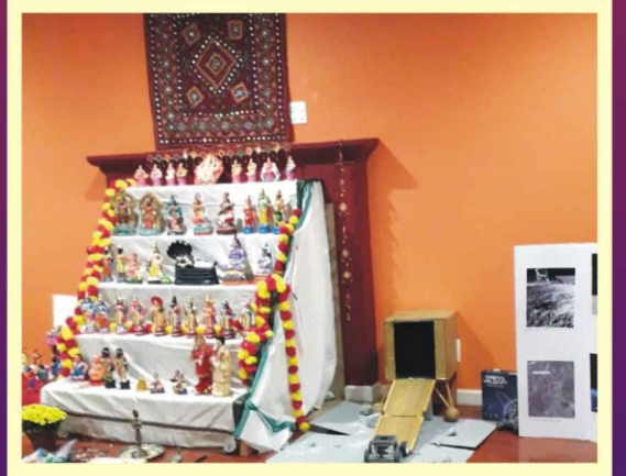
ஸ்ரீமதி ஸ்வேதா & ஸ்ரீ பிரதாப் USA இல்லத்தில் "சந்திரயான்" Working Model தீம் கொலு