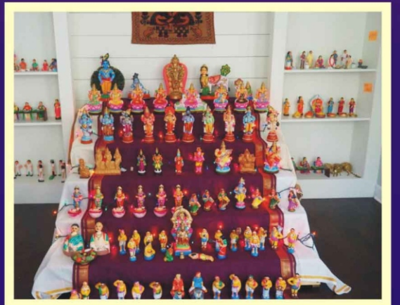
சேங்காலிபுரம் ஸ்ரீமதி பத்மாஸினி ராஜகோபாலன் USA இல்லத்தில்