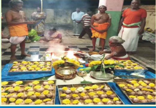
மொழையூர் சிவன் கோவில்