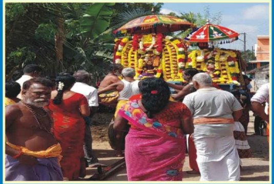
மேலப்பாலையூர் ஸ்ரீ நடராஜமூர்த்தி வீதியுலா