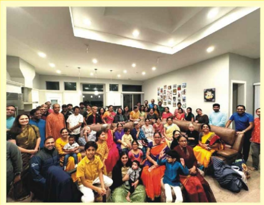
USA Bay Area வில் MDS சந்திப்பு