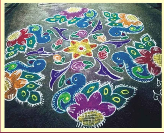
ஸ்ரீமதி புவனா வைத்து - முடிகொண்டான்