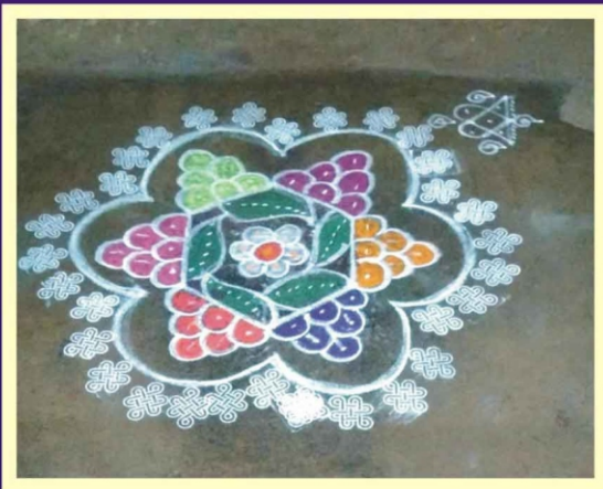
விஷ்ணுபுரம் ஸ்ரீமதி வீழி ராஜி