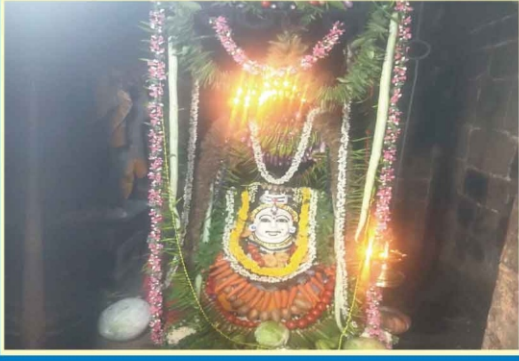
ஸ்ரீ பஞ்சவடஸ்வரர் ஆலயம், ஆனந்ததாண்டவபுரம்