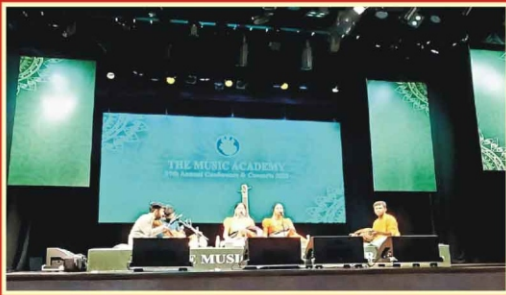
திப்பிராஜபுரம் ஸ்ரீ ஹரிகிருஷ்ணா மிருதங்கம்