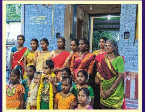
கோனேரிராஜபுரம் கூடாரவல்லி வைபவம்