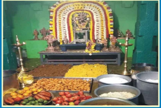
சேங்காலிபுரம் ஸ்ரீ சோளேஸ்வரர் ஆலயம்