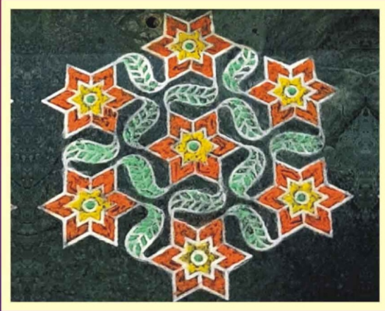
திப்பிராஜபுரம் ஸ்ரீமதி விலாசினி நாராயணன் - சென்னை