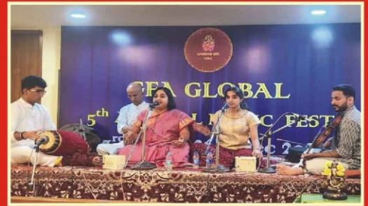
மாப்படுகை ஸ்ரீ ஸ்ரீஹரி மிருதங்கம்