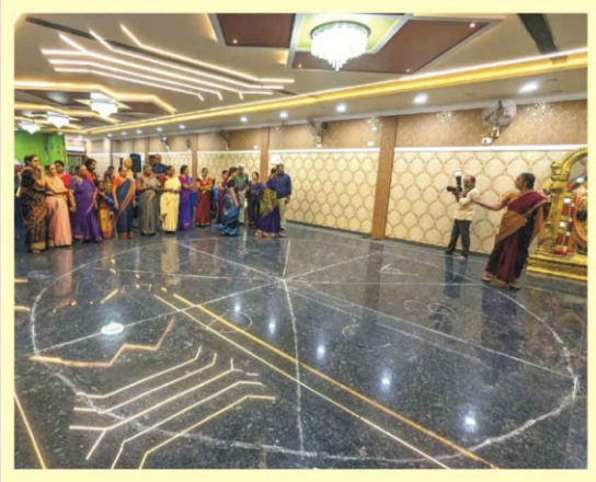
அங்கத்தினர்களின் விளையாட்டு போட்டி