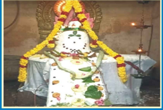
ஸ்ரீ வ்யாக்ரபுரீஸ்வரர் ஆலயம் புலியூர்