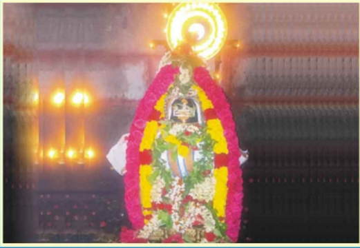
முடிகொண்டான் ஸ்ரீ காசி விஸ்வநாதர் கோவில்