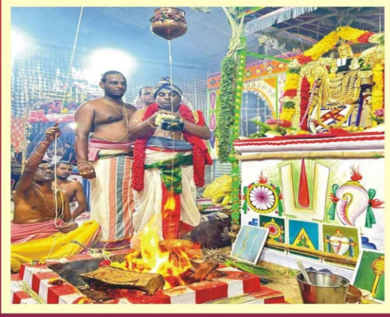
ஆனந்ததாண்டவபுரம் ஸ்ரீ வரதராஜ பெருமாள் கோவில் யாகசாலை