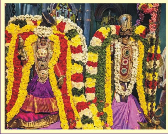
கூடாரவல்லி சிறப்பு அலங்காரம் கோனேரிராஜபுரம்