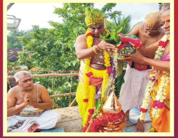
ஆனந்ததாண்டவபுரம் ஸ்ரீ வரதராஜ பெருமாள் கோவில் கும்பாபிஷேகம்