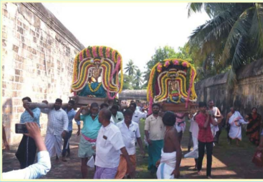
திருக்கோடிகாவல் ஸ்ரீ திருகோளேஸ்வரர் ஆலயம்