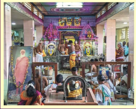
சேங்காலிபுரம் ஸ்ரீ தத்த ஜயந்தி உத்ஸவம்