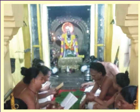
திருகோடிகாவல் ஸ்ரீ அபயஹஸ்த ஆஞ்சநேயர் திருக்கோயில் ஹனுமத் ஜெயந்தி முன்னிட்டு லட்ச்சார்ச்சனை