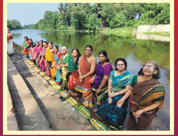
கனுப்பிடி வைத்தல் - திப்பிராஜபுரம்