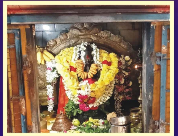
ஹனுமத் ஜெயந்தி சிறப்பு அலங்காரம்-தேதியூர்