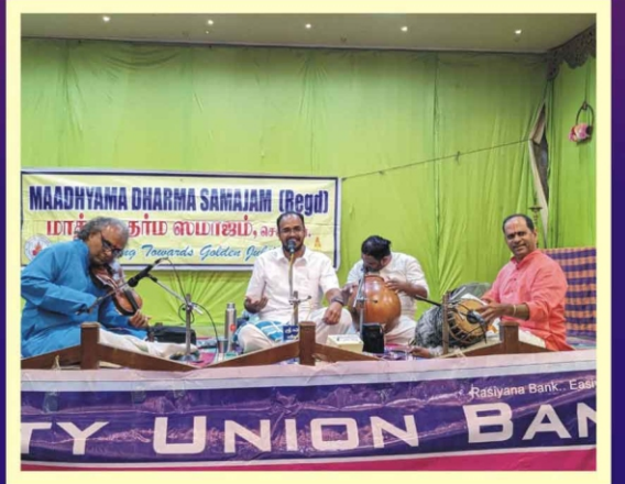
ஸ்ரீ பாலசிரிஷ் குழுவினரின் இன்னிசை