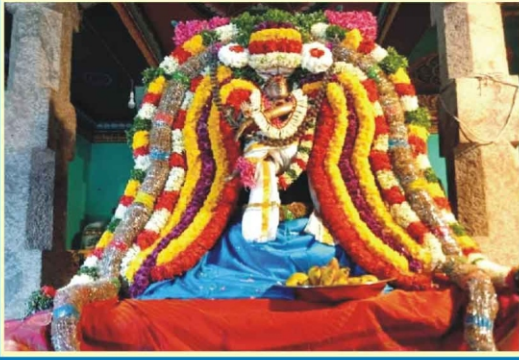
கோனேரிராஜபுரம் ஸ்ரீ நடராஜர் புறப்பாடு