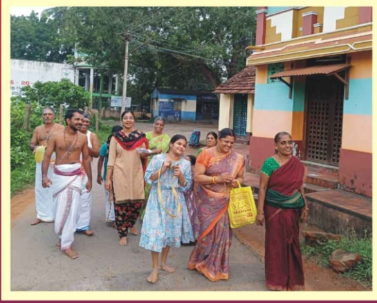
மார்கழி மாத வீதி பஜனை- விஷ்ணுபுரம்