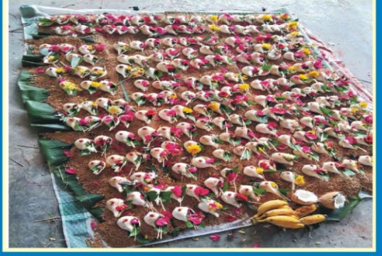
ஸ்ரீ வ்யாக்ரபுரீஸ்வரர் ஆலயம் புலியூர்