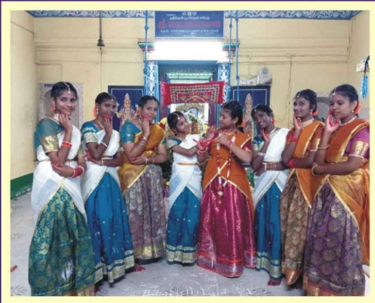
செம்மங்குடி ஸ்ரீ வரதராஜ பெருமாள் கோவில் கூடாரவல்லி வைபவம்-பெண்கள் கோலாட்டம்