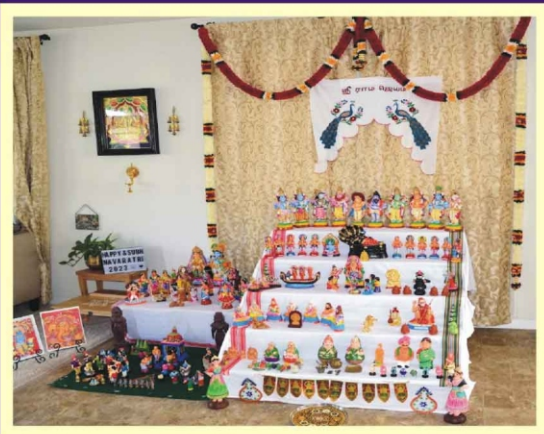
சேங்காலிபுரம் ஸ்ரீமதி புஷ்கலா ராஜ் USA இல்லத்தில்