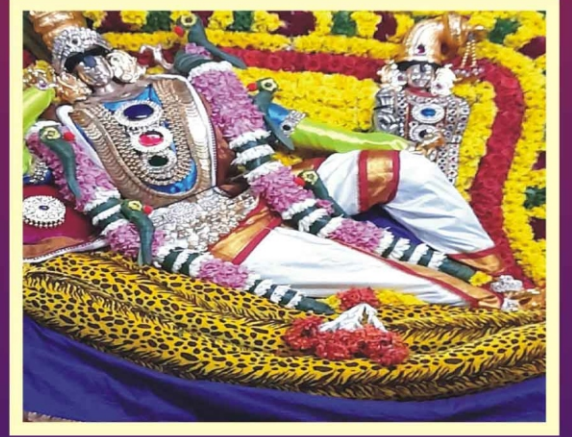
வைகுண்ட ஏகாதேசி சிறப்பு அலங்காரம்-விஷ்ணுபுரம்